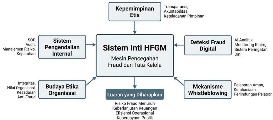
Gambar 2. Model Healthcare Fraud Governance Model (HFGM) 2026

Berdasarkan temuan tersebut, artikel ini merekomendasikan penerapan Model Tata Kelola Fraud Pelayanan Kesehatan (HFGM) sebagai kerangka strategis pencegahan fraud. Model ini mengintegrasikan lima pilar utama, yaitu kepemimpinan etis, pengendalian internal, deteksi fraud digital, budaya etika, dan whistleblowing mechanism. Implementasi model ini diharapkan mampu menurunkan risiko fraud, meningkatkan efisiensi pembiayaan, serta memperkuat kepercayaan publik terhadap sistem kesehatan nasional.